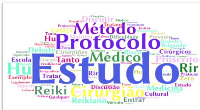
Figura 6- Nuvem de palavras das respostas da subcategoria Medo.

Apesar das pesquisas e de já existirem pós-graduação e especialidades médicas na homeopatia, acupuntura e medicina antroposófica, docentes e discentes necessitam que haja protocolos pré-determinados nas PIC. Mas, na visão integral do ser abordada nessas terapias complementares e integrativas, o tratamento é individualizado, relacionado a seus aspectos físicos, mentais, sociais e espirituais, não podendo ser repetido, na forma integral, entre indivíduos diferentes, pois essa é um princípio do tratamento com as PIC. A percepção dessa abordagem diferenciada do paciente traz insegurança para os futuros profissionais como observamos na fala: