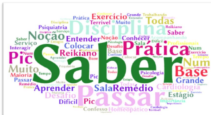
Figura 9- Nuvem de palavras das respostas da categoria Falta de transdisciplinaridade.

Segundo Ivani Fazenda, a transdisciplinaridade deve coordenar todas as disciplinas e interdisciplinas do sistema de ensino inovado, sobre a base de um axioma geral, destina-se a um sistema de nível e objetivos múltiplos, deve haver uma coordenação com vistas a uma finalidade comum dos sistemas (FAZENDA, 2011).