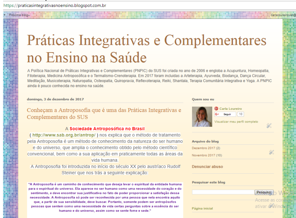
Figura 11: Publicação do blog sobre Práticas Integrativas e Complementares no Ensino na Saúde.

O uso da tecnologia no ensino em saúde como um e-book e um blog, possibilitou o acesso e o conhecimento de conteúdos de relevância sobre a PIC e a PNPIC na população acadêmica e na comunidade em geral, pois sua capacidade de acesso gratuito e universal a várias temáticas torna-o uma ferramenta cooperativa.