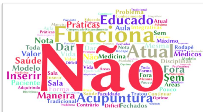
Figura 3- Nuvem de palavras das respostas da categoria Carência de incentivo/divulgação das PIC pelos médicos docentes.

A faculdade de Ciências Biológicas e da Saúde Doutor Bezerra de Menezes, de Curitiba (PR), abriu em 1994 o curso de naturologia aplicada em terapias naturistas que tem como objeto de estudo as práticas de medicina integrativa e complementar. O Ministério da Educação justificou a abertura desse curso porque no Brasil, a maioria dos terapeutas naturais era autodidata ou se formavam em cursos de curta duração não reconhecidos pelas instituições oficiais. O graduado que participa do curso passa a ter habilitação em fitoterapia, acupuntura e naturopatia (AZEVEDO; PELICIONI, 2012).