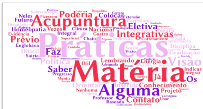
Figura 1- Nuvem de palavras das respostas da categoria Desconhecimento da PNPIC.

Durante o grupo focal, os discentes mostraram desconhecimento da PNPIC, como as falas de Guto e Tine: