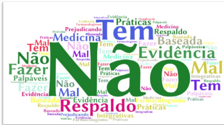
Figura 8- Nuvem de palavras das respostas de categoria Falta de evidência científica.

As PIC vêm sendo discutidas e estudadas no âmbito de projetos, pesquisa e extensão em IES no Brasil e fora dele. As publicações existentes em sites de busca por artigos científicos relacionados aos efeitos, causas, indicações e contraindicações, por exemplo, da acupuntura, fitoterapia, reiki, cromoterapia, florais, homeopatia, trazem dados concretos sobre sua associação com dados pautados nas evidências científicas, mas apesar dessa observação os discentes trazem nas suas falas algo que discorda desse contexto (AZEVEDO; PELICIONI. 2012):