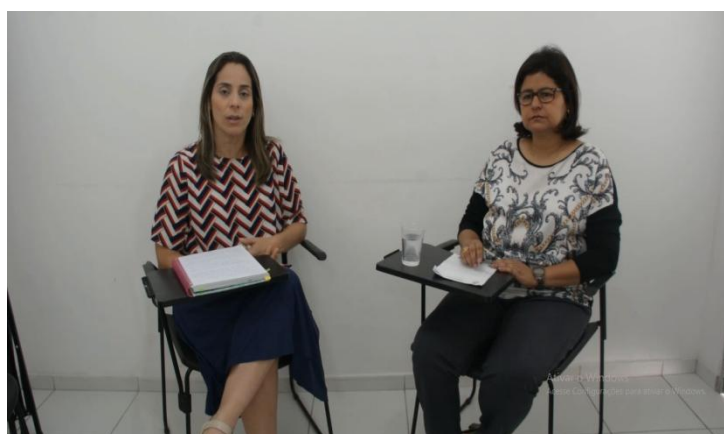
FIGURA 2 – Oficina de instrução ao sósia