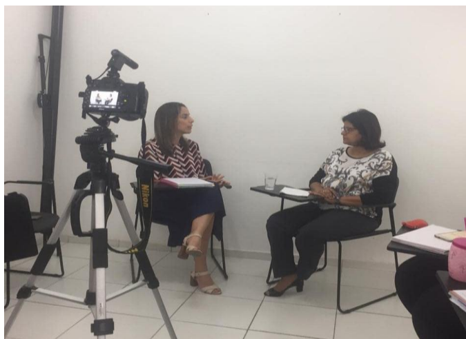
FIGURA 1 – Oficina de instrução ao sósia

ao Sósia e sua importância, bem como as possíveis aplicações junto ao grupo de preceptores da residência médica. Esses momentos podem ser observados nas imagens abaixo (figuras 1 a 4):