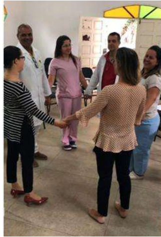
Figura 1 - Dinâmica “De mãos dadas”