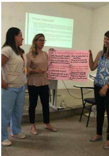
Figura 5 - Cartaz com árvore explicativa (grupo 2)