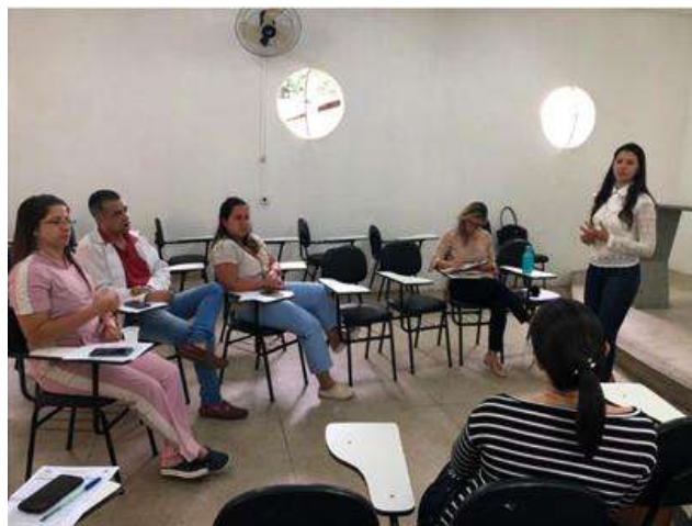
Figura 2 - Socialização da dinâmica “De mãos dadas”

Ao realizar a tarefa, os participantes não conseguiram atingir o objetivo de identificar os colegas da direita e da esquerda, por isso, chegaram ao consenso de finalizar a dinâmica. É importante destacar que sempre escutavam uns aos outros. Ao final, foi realizada a socialização da dinâmica sobre união, consenso, liderança e a desistência já nos primeiros obstáculos (Figura 2).