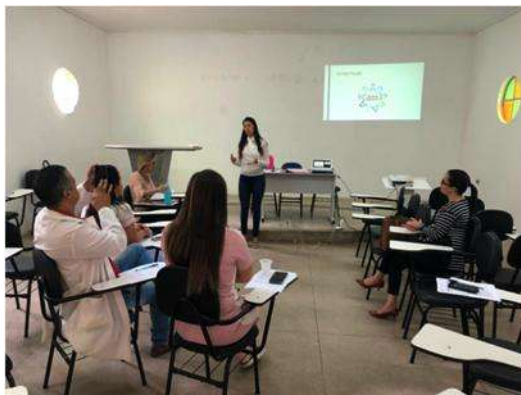
Figura 3 - Exposição de conceitos sobre Planejamento

Dando continuidade, a facilitadora, brevemente, apresentou em Powerpoint os conceitos de integração e planejamento estratégico (Figura 3).