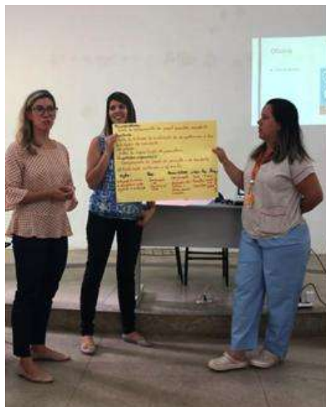
Figura 6 - Cartaz com planejamento estratégico (grupo 1)

No decorrer do processo de aplicação da oficina, os grupos foram convidados a escolher um problema identificado e, a partir dele, elaborar um planejamento estratégico simplificado, considerando os seguintes aspectos: levantamento de macroproblema, problema, nó-crítico, resultado esperado, ações, responsáveis, parceiros, indicadores, recursos necessários e prazos. O grupo elaborou um cartaz e o apresentou (Figura 6 e Figura 7). O momento foi muito rico, com verbalizações de que eram sugestões para a realidade vivenciada no dia a dia não apenas para a SP.