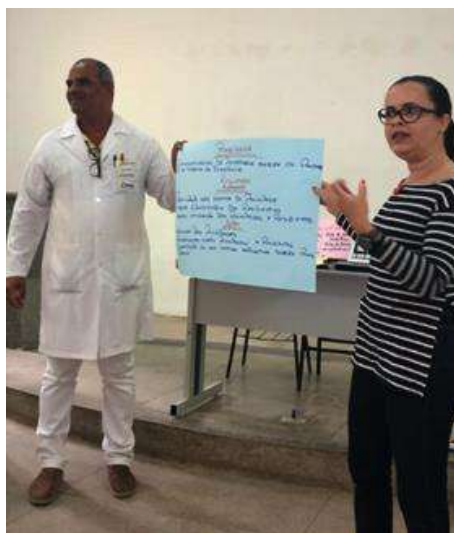
Figura 7 - Cartaz com planejamento estratégico (grupo 2)