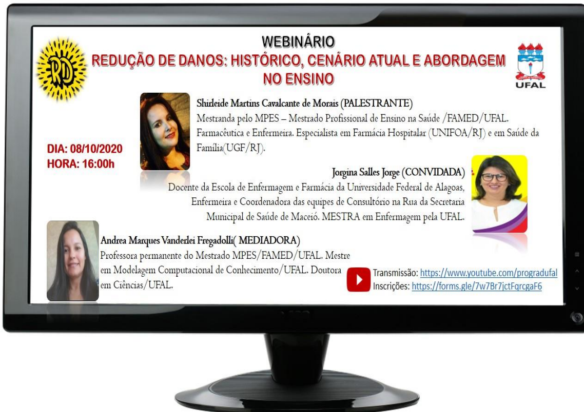
Figura 2: Card para divulgação do evento.

Em seguida foi disponibilizada a informação da emissão de certificado com carga horária de 2 horas e QR code para comprovar sua idoneidade. O mesmo foi enviado para o email dos inscritos após a participação e avaliação no webinar (figura 3).