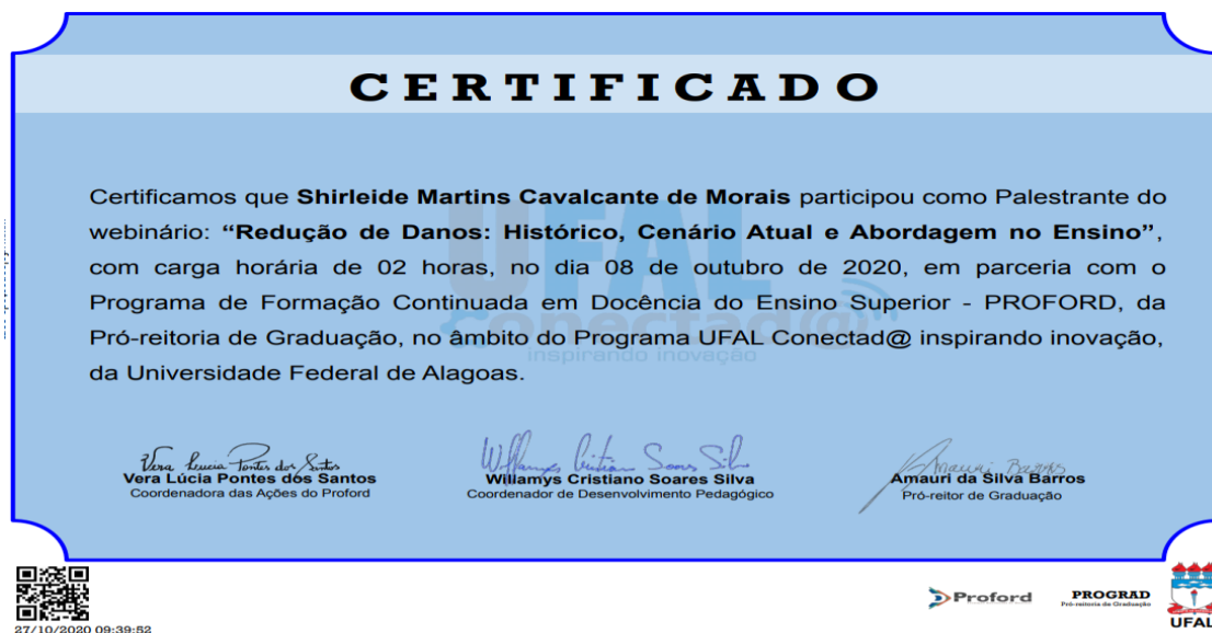
Figura 3: Certificado disponibilizado pela participação ao evento.