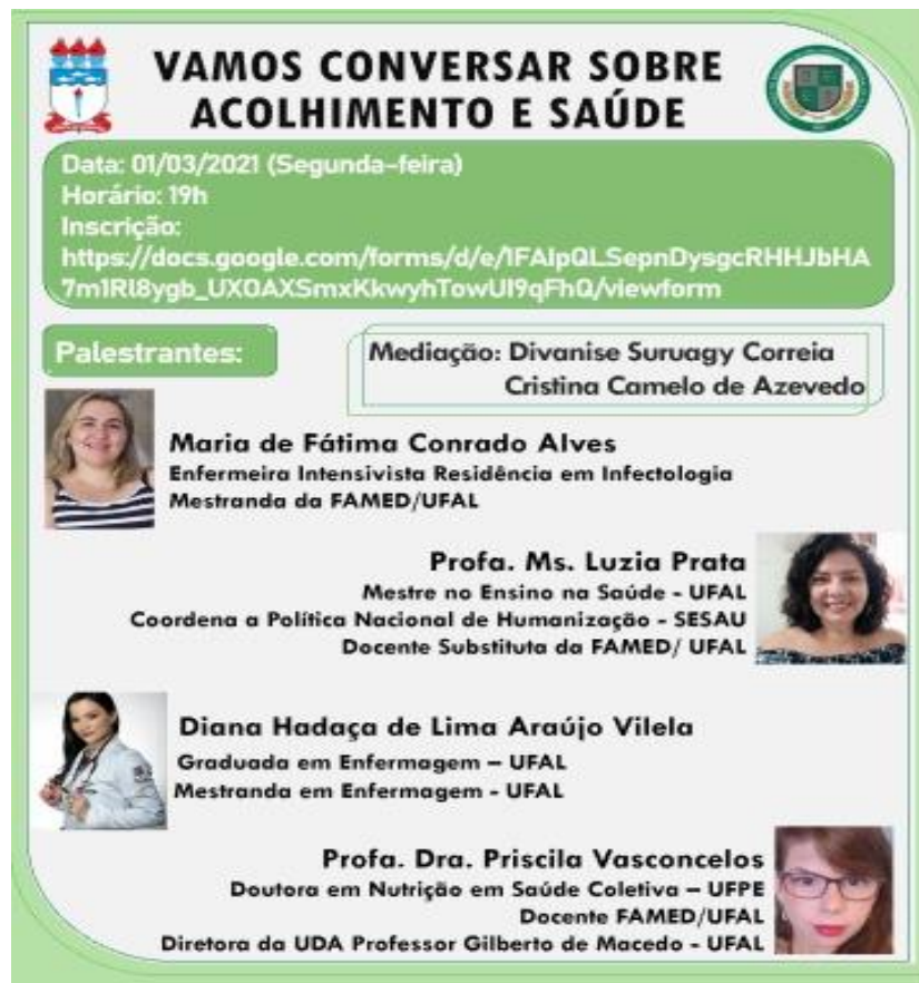
FIGURA 2 – Card de divulgação do evento