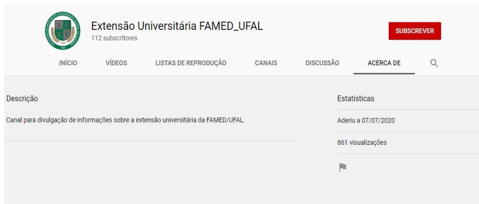
FIGURA 1 – Canal utilizado para apresentação do webinar.