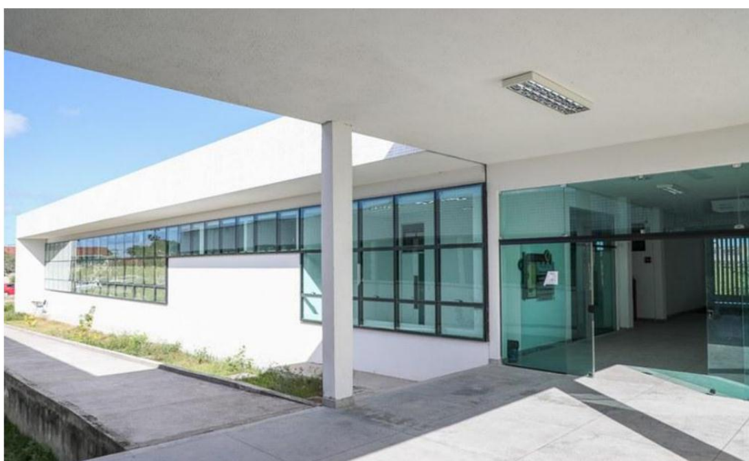
Foto 02 – Perspectiva frontal da Unidade Docente Assistencial (FAMED/UFAL).

Inaugurada em 11 de outubro de 2019, a Unidade Docente Assistencial (UDA) Professor Gilberto de Macedo tem como objetivo expandir os cenários de prática da Faculdade de Medicina (FAMED) com a oferta de serviços assistenciais à população circunvizinha ao Campus A. C. Simões. Foi construída com recursos do Programa Mais Médicos.